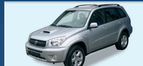
TOYOTA RAV4 2.0 TDI D-4D SOL 5P NEW KM.0 - ANNO 2005 € 26.500 IVA ESPOSTA