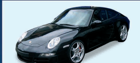
PORSCHE 997 S COUPÈ' IPER FULL - NEW KM.0 SCONTO DA LISTINO