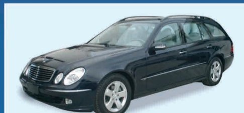
M.B. E270 CDI SW AVANTGARDE IPER FULL - ANNO 2003 € 35.000