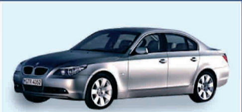
BMW NEW 530d FUTURA IPER ACCESSORIATE - ANNO 2004 € 42.000 IVA ESPOSTA