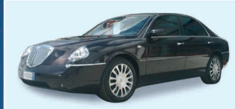
LANCIA THESIS 2.4 JTD/150 EMBLEMA IPER FULL - ANNO 2003 € 28.000