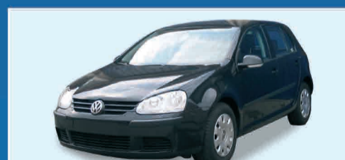
VW GOLF V 1.9 TDI COMFORTLINE 5P CLIMATRONIC+RADIO CD+V. MET. SEMESTRALE € 18.000 IVA ESPOSTA