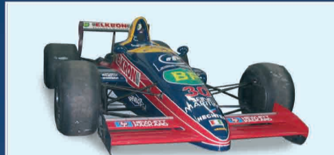
LOLA LARROUSSE CALMELS F.1 COSWORTH EX ALLIOT ANNO 1988 TRATTATIVA RISERVATA