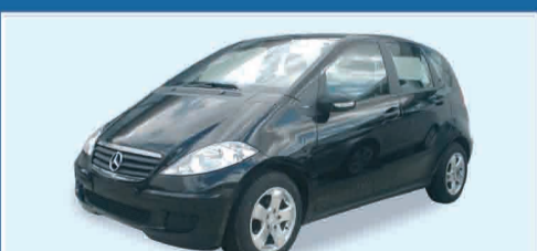
M.B. NEW A180 CDI CLASSIC FULL OPT. - SEMESTRALE € 19.500