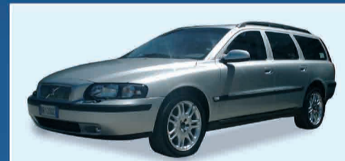
VOLVO V70 T5 OPTIMA FULL OPT. - ANNO 2001 € 15.000 IVA ESPOSTA