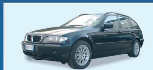
BMW 320d 150CV ELETTA FULL OPT. - ANNO 2002 € 20.000 TRATTABILI