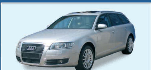
AUDI NEW A6 AVANT 3.0 V6 TDI TIPTRONIC IPER FULL - NEW KM.0 SCONTO DA LISTINO