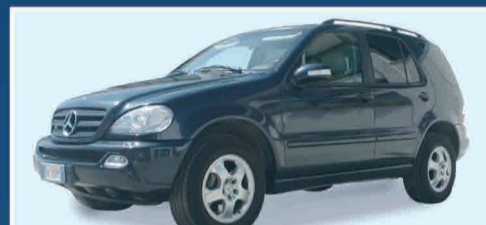
M.B. ML 270 CDI FULL OPT. USA UFFICIO CAT. N1 - ANNO 2002 € 30.000 IVA ESPOSTA