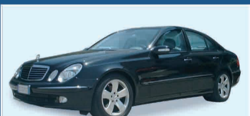
M.B. E270 CDI AVANTGARDE PARI AL NUOVO ANNO 07/2002 KM. 31.000 € 30.000 IVA ESPOSTA