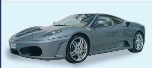
FERRARI F430 F1 COUPÈ GRIGIO TITANIO - ANNO 2005 PRONTA CONSEGNA PREZZO DI LISTINO