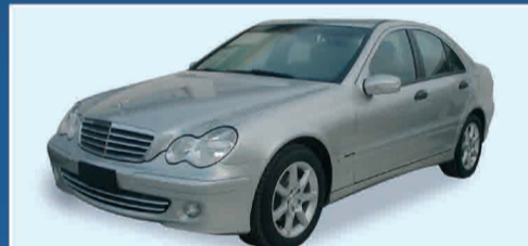
M.B. C220 CDI NEW GENERATION NUOVA DA IMMATICOLARE UFFICIALE € 31.000 IVA ESPOSTA