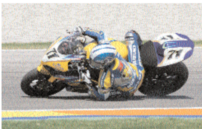
Yukio Kagayama in sella alla Suzuki Gsx-R 1000 è secondo in classifica