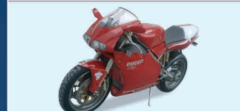
DUCATI 998 S 2002 CONDIZIONI DA CONCORSO KM. 4.400 € 13.500