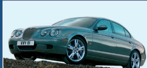
JAGUAR S-TYPE 2.5 V6 EXECUTIVE IPER ACCESSORIATA - ANNO 2002 € 25.000