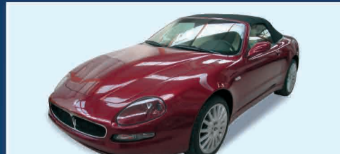
MASERATI SPYDER CAMBIOCORSA NUOVA DA IMMATICOLARE MOD. 2003 FORTE SCONTO DAL LISTINO