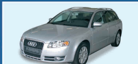
AUDI NEW A4 AVANT 2.0 TDI/140cv FULL OPT. - NEW KM 0 € 32.000 IVA ESPOSTA