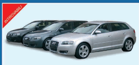
AUDI NEW A3 SPORTBACK 2.0 TDI AMBITION SEMESTRALI - COLORI VARI € 27.000 IVA ESPOSTA