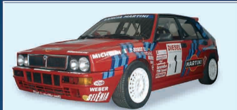
LANCIA DELTA HF EVOLUZIONE GR.N LIVREA MARTINI - PRONTA CORSE € 20.000