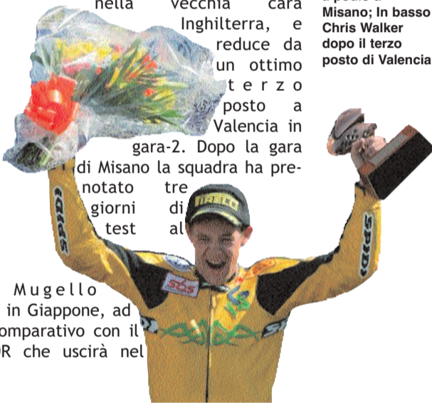
Nella foto a sinistra, un primo piano di Pierfrancesco Chili con lo sfondo della sua Honda CBR 1000. Il pilota bolognese potrebbe andare a podio a Misano; In basso Chris Walker dopo il terzo posto di Valencia