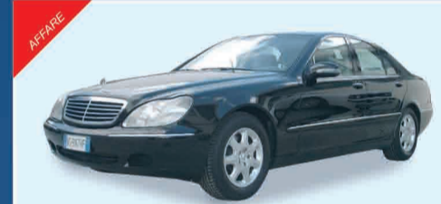
MERCEDES S320 CDI IPER ACCESSORIATA - ANNO 2002 € 30.000