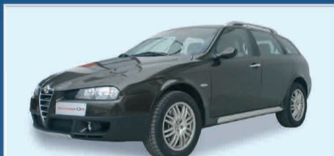
ALFA CROSSWAGON DISTINCTIVE AZIENDALE 2005 KM. 20.000 € 30.000 IVA ESPOSTA