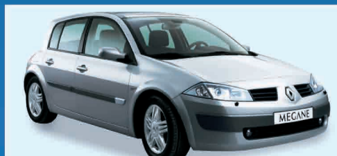
RENAULT MEGANE II 1.9 DCI 120 C. AUTHEN. 5P AZIENDALI 2004 € 14.000 IVA ESPOSTA