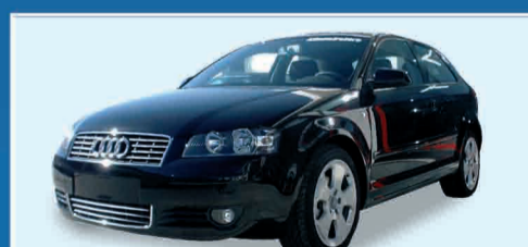
AUDI A3 2.0 TDI AMBITION SEMESTRALI - COLORI VARI € 23.500 IVA ESPOSTA