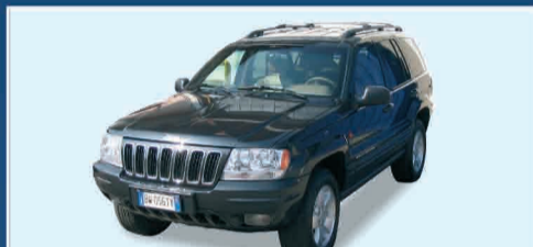
JEEP G. CHEROKEE 3.1 TD LIMITED FULL OPT. - CAT. "N1" - ANNO 2001 € 20.000 IVA ESPOSTA