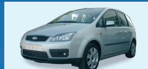
FORD FOCUS C-MAX 1.6 TDCI AZIENDALI 2004 € 15.500 IVA ESPOSTA