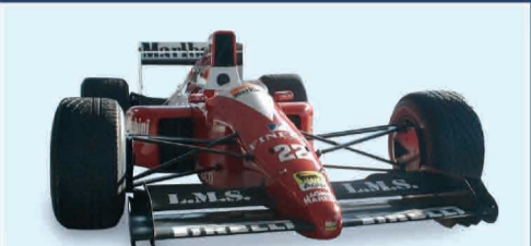
DALLARA F.1 '90 COSWORTH EX DE CESARIS ANNO 1990 TRATTATIVA RISERVATA