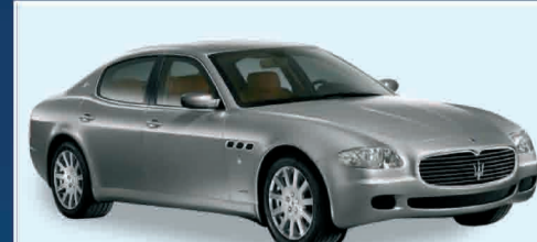
MASERATI QUATTROPORTE 4.2 V8 NUOVA DA IMMATICOLARE PREZZO INTERESSANTE