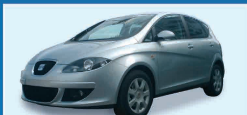
SEAT ALTEA 2.0 TDI STYLANCE NEW KM 0 UFFICIALE € 21.500 IVA ESPOSTA