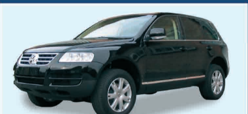
VW TOUAREG 3.0 V6 TDI TIPTRONIC IPER FULL - NEW KM.0 PRONTA CONSEGNA