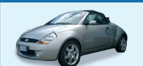
FORD STREET-KA 1.6 16V CABRIO IPER ACCESSORIATA ANNO 2003 € 12.000